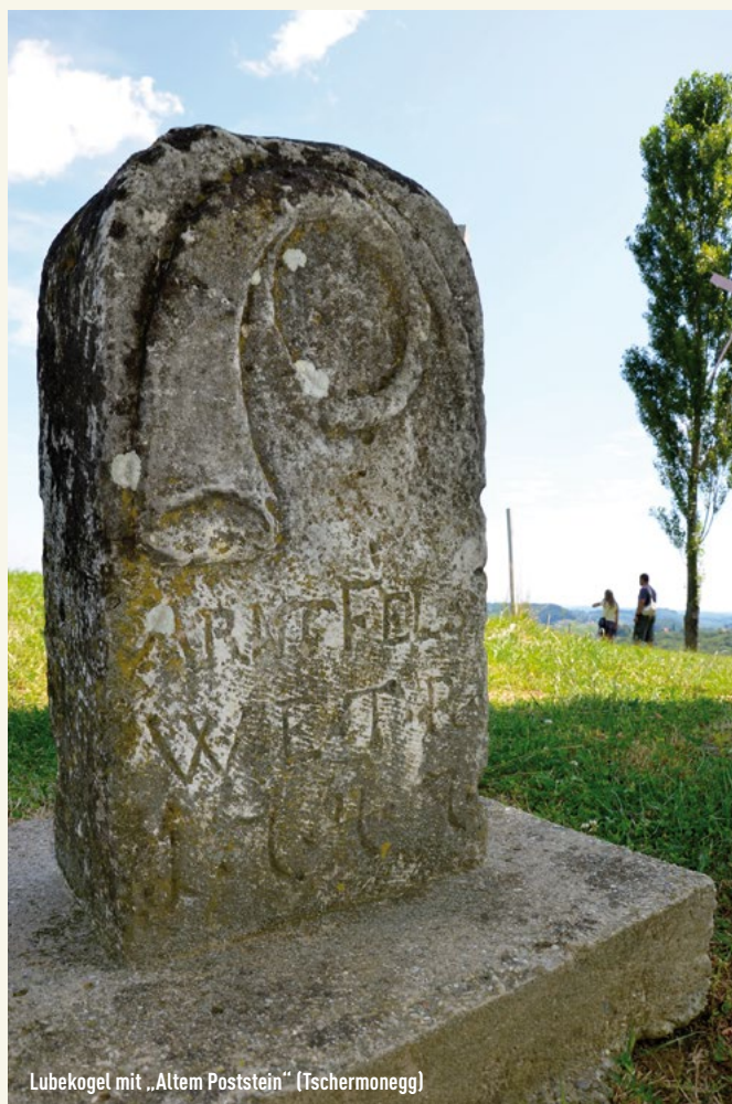
Lubekogel mit „Altem Poststein“ (Tschermonegg)

Direkt bei den GastgeberInnen befinden sich Infotafeln zur Weinkultur: den typisch südsteirischen Weinsorten, Ausbauweisen und mehr.